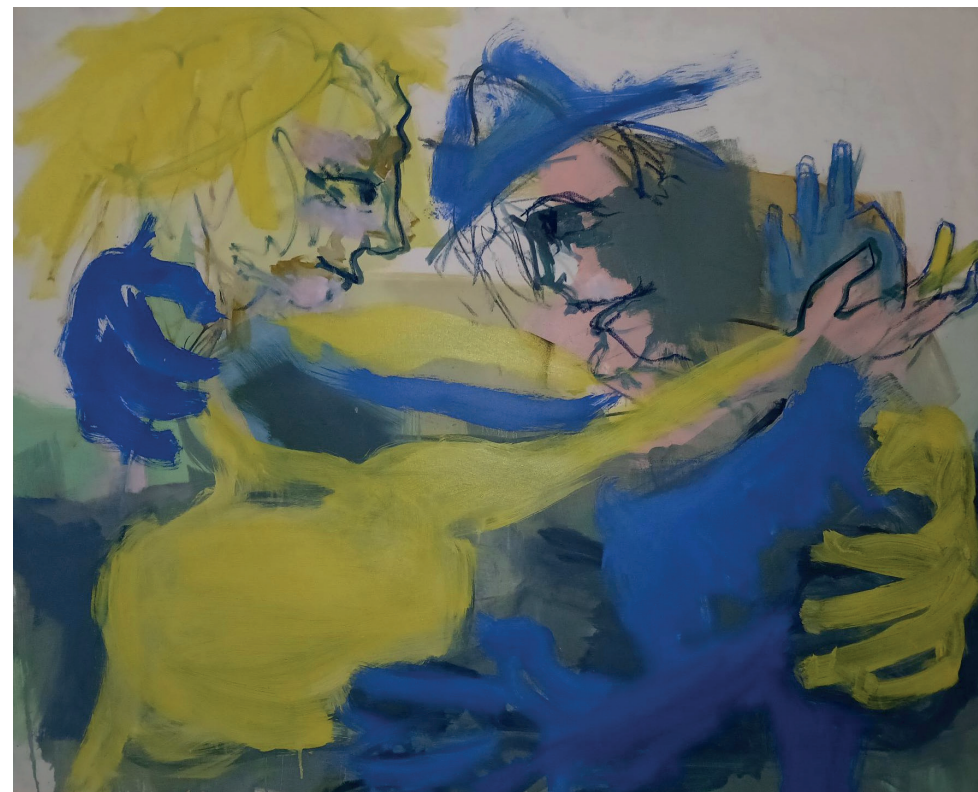
“Strangers become lovers become parents” - olio su tela, 120x150 cm - 2022

Spazio espositivo della Fondazione Friuli in via Gemona, 3 - Udine