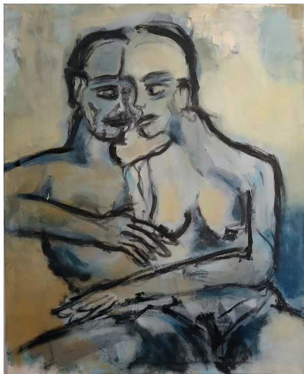
"Couple" - olio su tela, 100x80 cm - 2017

Questo si traduce nell'interazione dinamica e unica di piani e linee che caratterizza le mie opere".