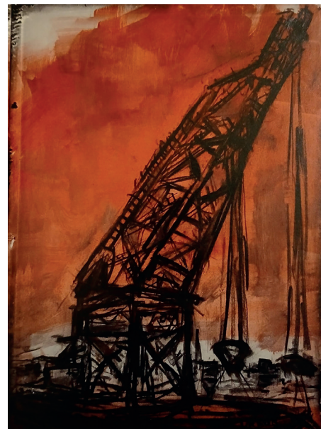
"Ursus Trieste" olio su tela, 120x80 cm - 2025