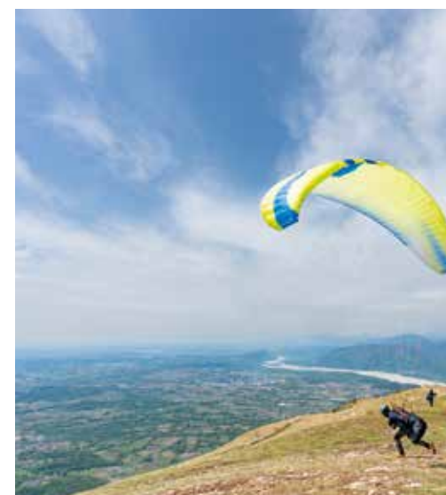
GEMONA DEL FRIULI. Monte Cuarnan.