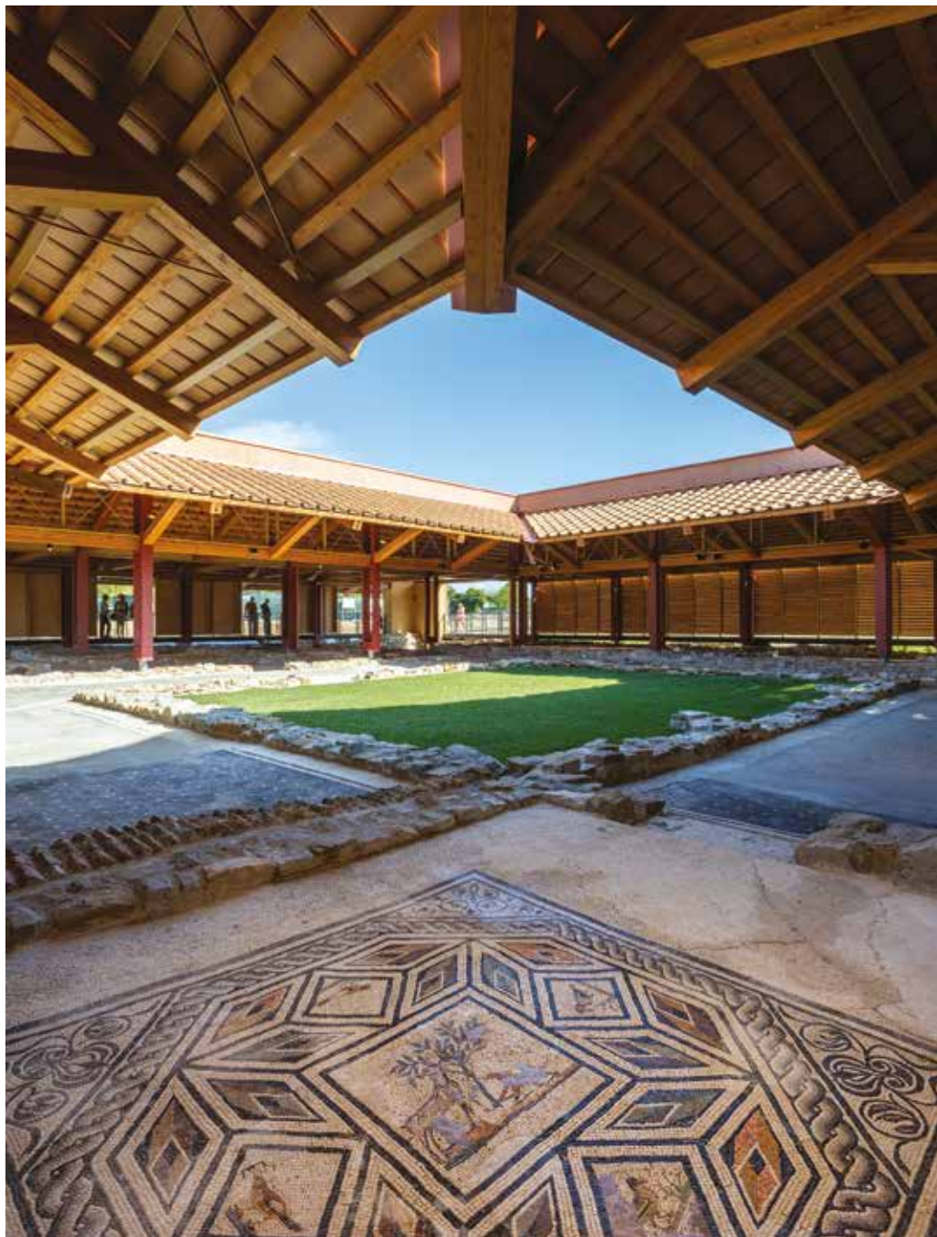
DOMUS DI TITO MACRO. Una delle più vaste dimore di epoca romana tra quelle rinvenute nel Nord Italia, copre una superficie di 1.700 metri quadrati e rappresenta un unicum in Europa.