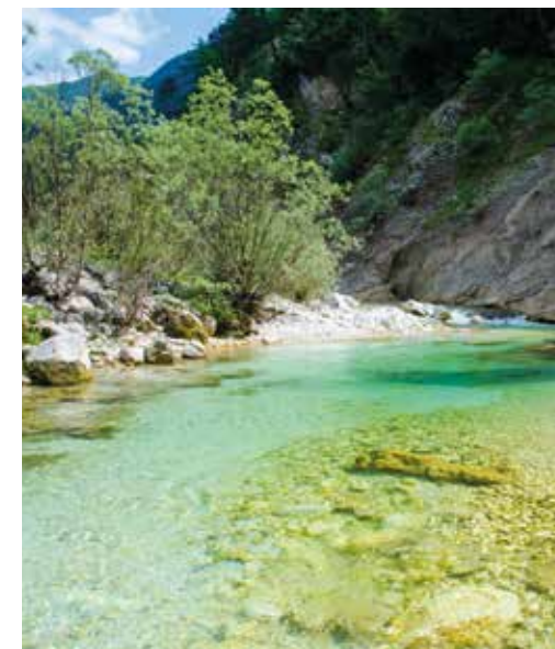
VAL RESIA. Ta Lipa Pot.