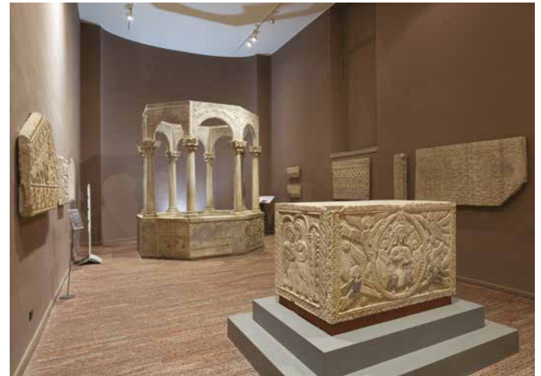
MuCRIS. Il Museo Cristiano e Tesoro del Duomo conserva preziosi capolavori della scultura longobarda, il Battistero di Callisto e l'Ara di Ratchis, oltre ad altre importanti opere dell'arte altomedievale.