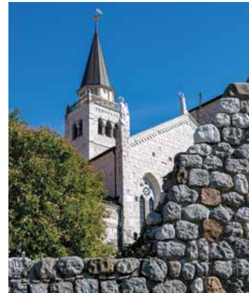
VENZONE. Duomo di Sant'Andrea Aposotolo.

Si tratta di un territorio straordinario che si estende per oltre 700 km 2 , un vero mosaico di biodiversità e culture millenarie, dove l'incontro con specie rare di flora e fauna fa parte dell'esperienza quotidiana. Qui si trovano percorsi escursionistici adatti a ogni livello, musei che raccontano la storia e le tradizioni delle comunità locali, ambienti naturali in cui immergersi per scoprire una ricca biodiversità e vette panoramiche da cui lo sguardo si apre oltre i confini. Dal 2024 è stata riconosciuta dall'Unesco come Riserva della Biosfera transfrontaliera congiuntamente alla Riserva della Biosfera delle Alpi Giulie slovene.