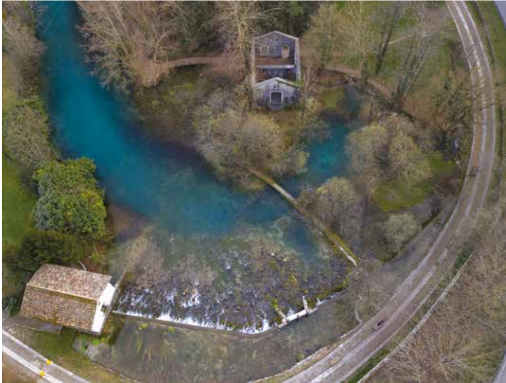
SORGENTI DEL FIUME LIVENZA.