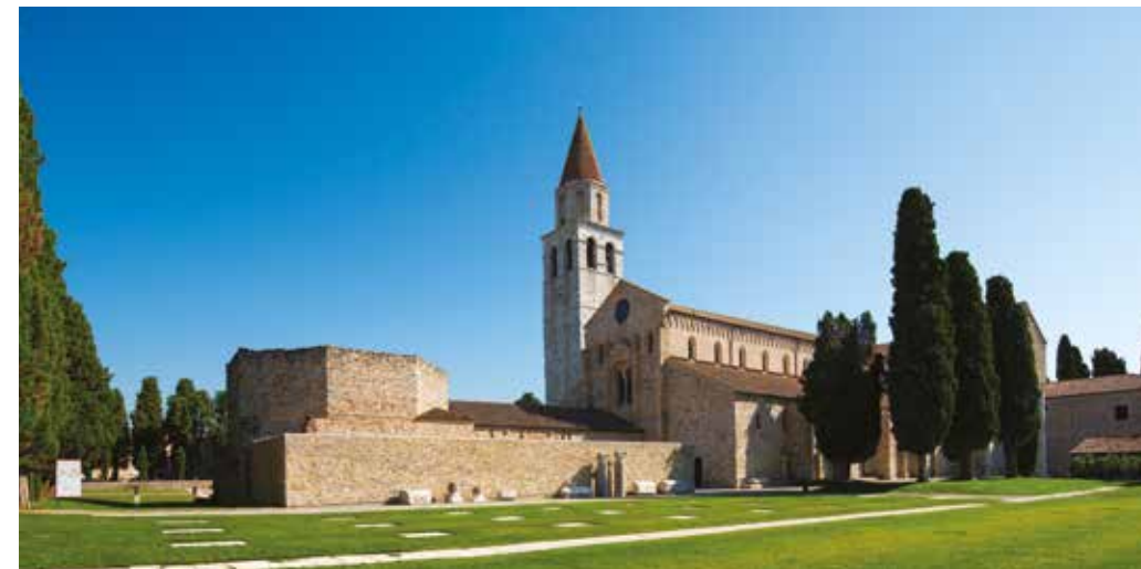
BASILICA DI SANTA MARIA ASSUNTA. Uno dei più importanti monumenti del Cristianesimo delle origini, rappresenta il cuore spirituale e storico dell'antica città romana.