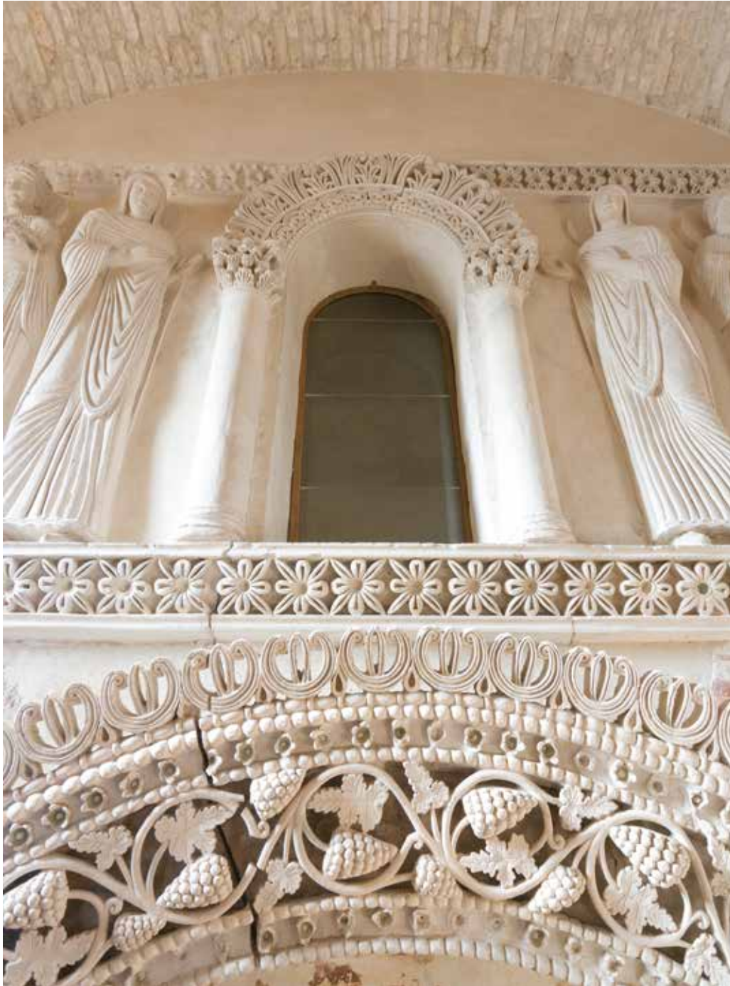
TEMPIETTO LONGOBARDO. Edificio unico nel suo genere: al suo interno, un sontuoso schema decorativo, comprendente stucchi e affreschi eseguiti in uno stile aulico e sapientemente raffinato, ne fanno una delle più splendide ed ambiziose commissioni giunte sino a noi dall'VIII secolo.

MUSEO ARCHEOLOGICO NAZIONALE. Cividale del Friuli, sede del primo ducato del Regno longobardo in Italia, conserva la collezione di manufatti più rilevante sul territorio nazionale.