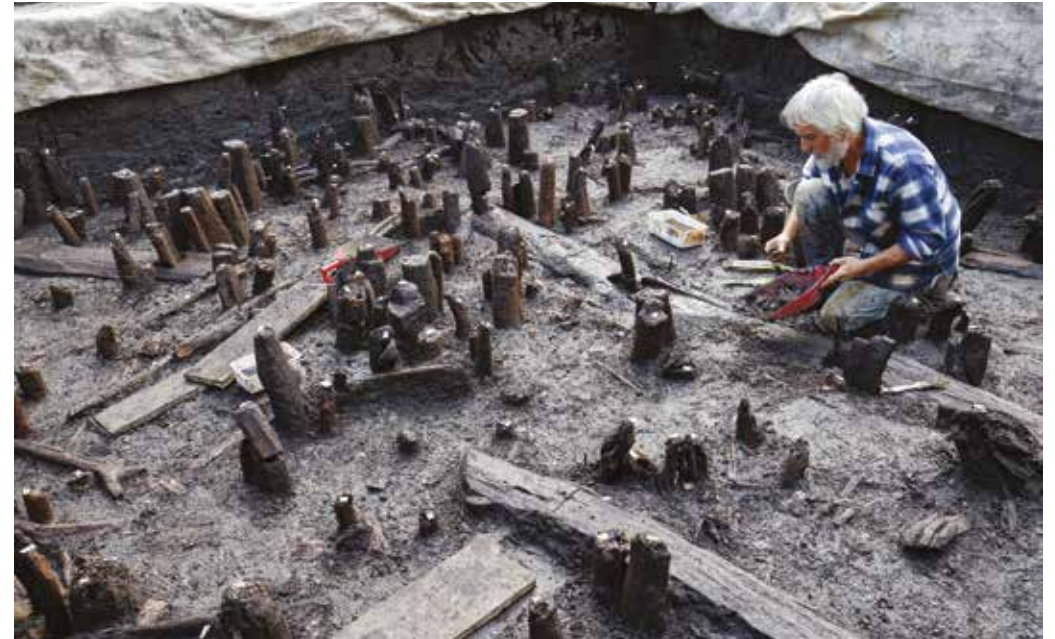
PALI INFISSI E TRAVI ORIZZONTALI pertinenti al villaggio palafitticolo.