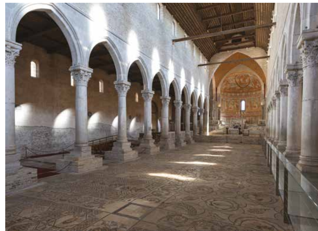
La basilica conserva uno straordinario PAVIMENTO MUSIVO tra i più estesi e meglio conservati dell'Occidente romano. Celebre per la ricchezza simbolica e le scene bibliche – come il ciclo di Giona – rappresenta una straordinaria testimonianza dell'arte paleocristiana e del ruolo centrale di Aquileia nel primo Cristianesimo.