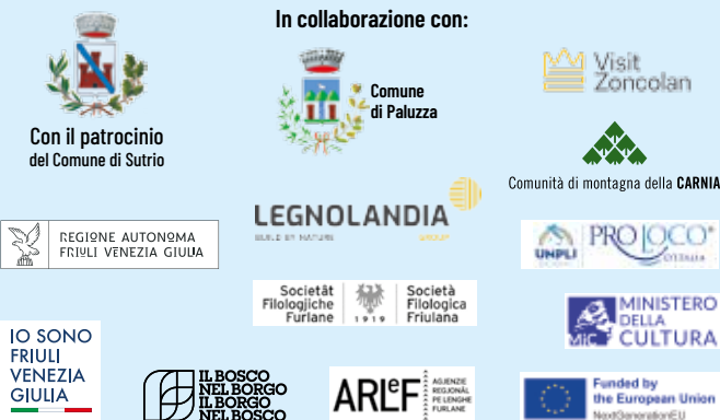
Grafica e stampa: Tipografia Cortolezzis - Paluzza (UD)