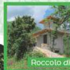
Roccolo di Manganel