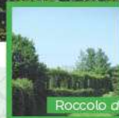
Roccolo di Pre Checo