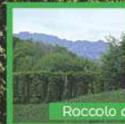
Roccolo del Puestin