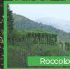
Roccolo di Spisso